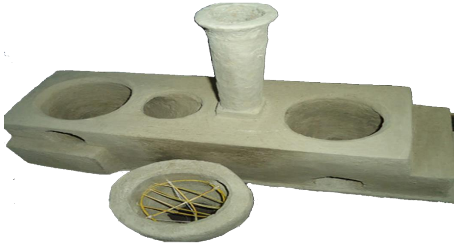
চিত্রঃ বন্ধু চুলা

পারিবারিক রান্নার কাজে বন্ধু চুলার জুড়ি মেলা ভার। ছাত্রাবাস, হাসপাতাল, সেনানিবাস, পুলিশ ফাঁড়ি প্রভৃতি প্রতিষ্ঠান বন্ধু চুলা ব্যবহার করে জ্বালানি খরচ অর্ধেক কমিয়ে এনেছে। রেস্টুরা, চায়ের দোকান প্রভৃতি বাণিজ্যিক প্রতিষ্ঠানও বন্ধু চুলা ব্যবহার করে অর্থনৈতিকভাবে লাভবান হচ্ছে। বর্তমানে বিভিন্ন শিল্প-কারখানাতেও সফলভাবে বন্ধু চুলা ব্যবহৃত হচ্ছে এবং তা ব্যবসায়িক মুনাফা বৃদ্ধিতে ব্যাপকভাবে সহায়তা করছে। যেখানে শুকনা কাঠ, খড় ইত্যাদি জ্বালানি ব্যবহৃত হয় সেখানেই বন্ধু চুলা উপযোগী বলে জানান উদ্যোক্তারা।